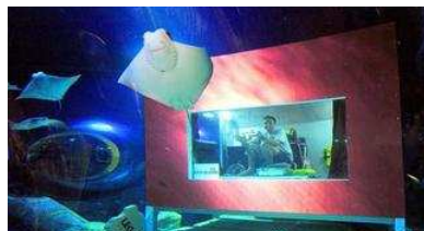
Verrücktes Experiment: Im Legoland Deutschland wohnt ein Mann zwei Wochen lang in einem Aquarium.