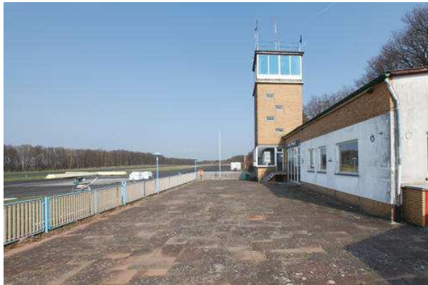
Wird geschlossen-der Flugplatz in Eddesse.

Aus Sicherheitsgründen hat die Luftfahrtbehörde den Flugplatz in Eddesse geschlossen. Die Flugfördergemeinschaft Peine hat ihr altes Domizil schon verlassen, der Vorsitzende beklagt die „Misswirtschaft“ des Betreibers.